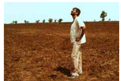
Goute d'argent Maudite pluie atish Manwar (Inde), 2009, 93 min