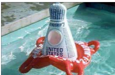
Prix du jury Poussières d'Amérique Arnaud des Pallières France, 2011, 100 min.