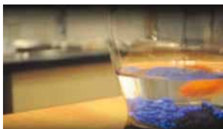
Goutte d'or L'eau c'est vital Camille Mongeau Canada, 2010, 1 min.