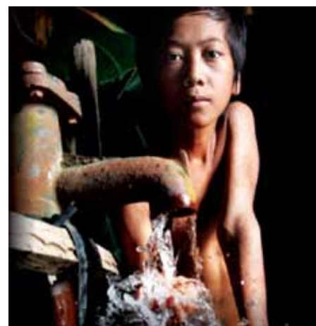
Goutte de bronze « Born sweet » Cynthia Wade Cambodge, 2011, 28 min.