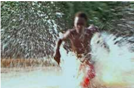
Goutte d'argent Suka Feto. L'enfant dans la mare Didier Bergounhoux France, 2011, 23 min.