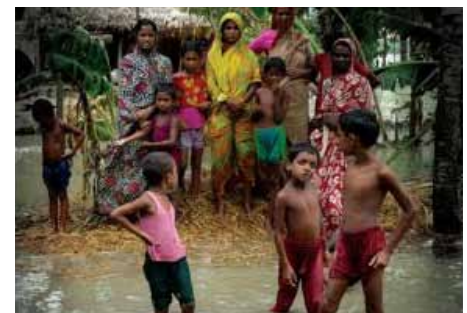
Goutte de bronze De plein fouet, le climat vu du Sud Wereldmediatheek, Belgique, 2009, 53 min.