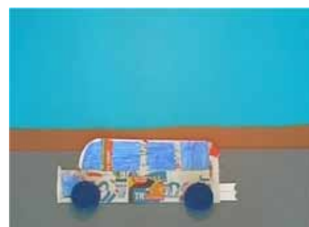
Goutte de bronze Génération écolo Cellofan, France, 3 min.