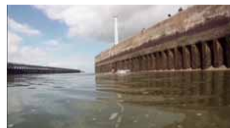
Goutte d'argent « Water closed » Lycée Marie-Josephe de Trouville-sur-Mer, France, 2011, 3 min.