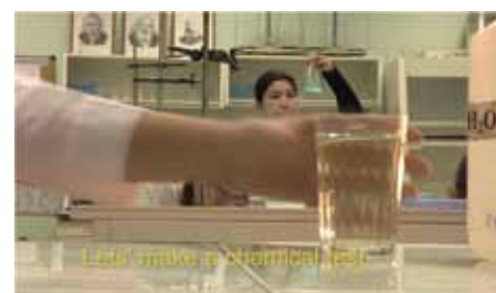
Goutte d'or Un verre d'eau pure Elizaveta Yachmeneva Russie, 2011, 6 min