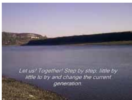
Goutte de bronze L'eau, le commencement de tous les commencements Savca Dmitri & Tatiana Bezedo, Moldavie, 2011, 1 min