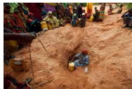
Goutte d'or Quand l'eau manque Evan Abramson & Carmen Elsa Lopez États-Unis, 2010, 16 min.