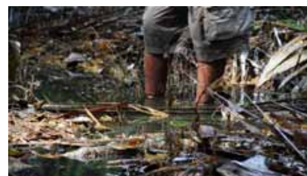
Goutte d'argent Nigeria, l'éternelle marée noire Yann Le Gléau France, 2011, 22 min.