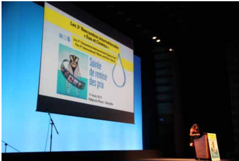
Remise des prix au Palais du Pharo (Marseille, mars 2012).